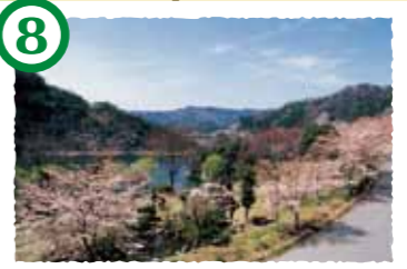
8 君ヶ野ダム公園 春の桜、夏の新緑、秋の紅葉、冬の雪景色と四季折々の景観が楽しめます。特に春の桜と噴水、それらがダム湖に映る姿は圧巻。