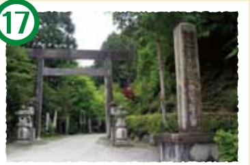
17 川上山若宮八幡神社 山岳美と渓谷美を兼ね備えた雲出川の水源にあり、近畿最古といわれる社。多くの参詣者が訪れ、春と秋には大祭も行われます。