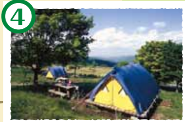
4 スカイランドおおぼら ☎059-272-1138 大洞山の標高700mに位置し、夏でも涼しく、キャンプ、パターゴルフ、などを楽しむことができます。