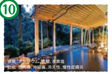
10 美杉リゾート 火の谷温泉 ☎059-272-1155 温泉施設「雲出湯館」には室内大浴場や風情ある露天風呂のほか、打たせ湯、サウナなど8種類のお風呂があり、日帰り楽しめます。