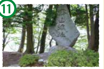
11 霧山城址 霧山城址には、鐘楼堂跡や土塁・堀切が残り、中世の城の形状をとどめています。城址からは、360°の眺望が楽しめます。登山口から徒歩40分。