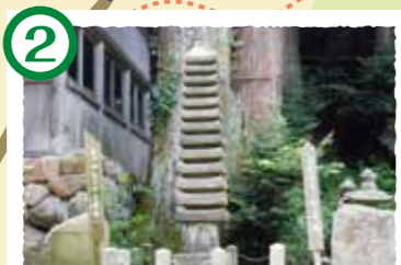
2 国津神社十三重塔 鎌倉時代後期の石像美術を代表する高さ3.8mの十三重石塔。国の重要文化財に指定されています。