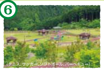
6 フットパーク美杉 ☎059-274-1189 大人も子どもも気軽にアウトドアが楽しめる本格レジャー施設。ピクニック広場があり、自然に囲まれたスポーツフィールドです。