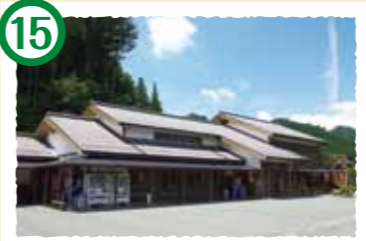
15 道の駅美杉 ☎059-275-0339 美杉材の販売、展示、地域の特産品の販売の他、食事なども楽しめます。秋には毎年恒例の「道の駅美杉サンクスフェスタ」を開催。