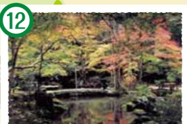
12 北畠神社 北畠氏館跡庭園 室町時代の貴重な文化遺産として国の名勝及び史跡に指定されている庭園。日本三大武將庭園のひとつに数えられる名園。