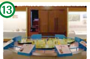
13 美杉ふるさと資料館 ☎059-275-0240 北畠氏に関する出土品や古文書、絵図をはじめ、地域の民俗資料などを展示しています。木工体験のできる創作館を併設。