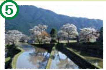
5 三多気の桜 伊勢本街道から真福院までの参道に、並木道が1.5km続くヤマザクラ。国指定名勝、「さくら名所100選」に認定されています。