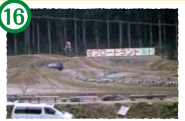
16 オフロードランド美杉 ☎059-275-8008 モトクロスに最適な土質と、初心者から上級レーサーまで楽しんでもらえるコースが自慢のモトクロス&オフロード専用コースです。