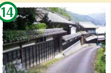
14 伊勢本街道 大和と伊勢を結ぶ最短ルートであった参宮街道。街道沿いには道標や家並みなどが多く残り、歴史を偲ぶ絶好の散策スポットです。